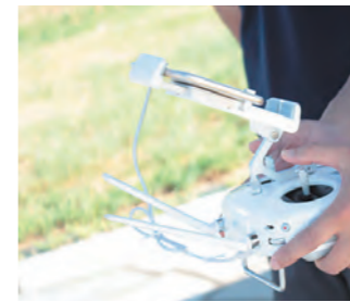
コンサルティング・業務支援